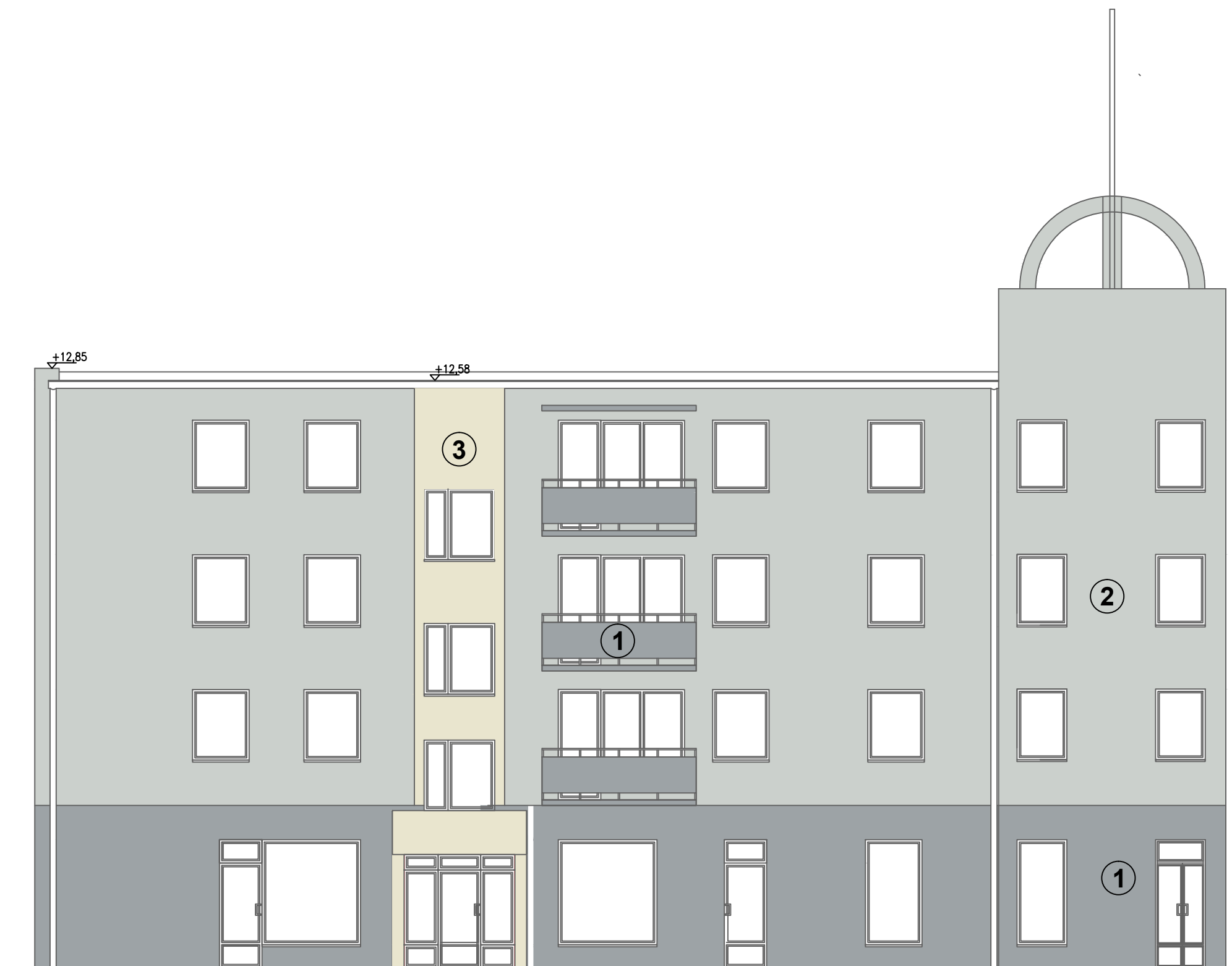
ELEWACJA PÓŁNOCNA 1:100